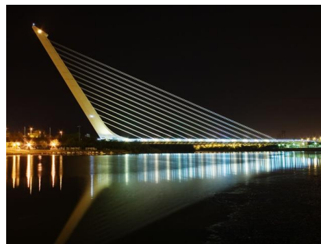
Puente del Alamillo

Fue diseñado por el arquitecto Santiago Calatrava para la Expo'92