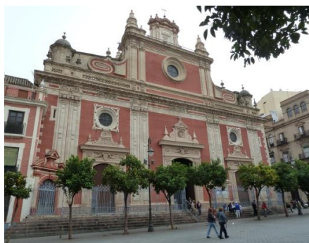
Iglesia de San Salvador

Es una de las iglesias más importantes de Sevilla. Dentro, se puede ver la imagen de "Jesus de la Pasión", que sale en procesión el Jueves santo.