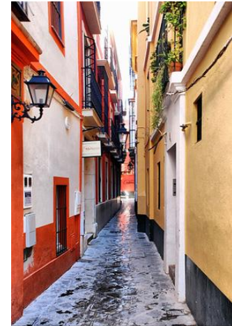
El Barrio de Santa Cruz

Barrio situado en el centro de la ciudad. Destaca por sus calles estrechas y patios interiores.