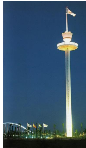
La Torre Banesto

Fue construida en 1989 como atracción para la Expo'92 (Exposición Universal de 1992).