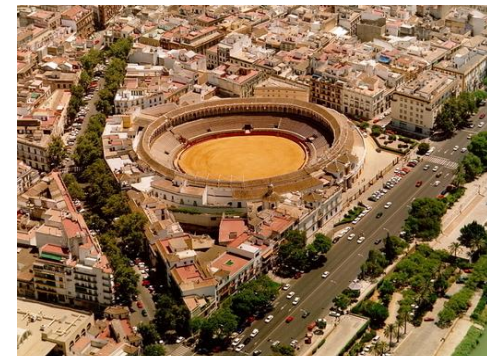
La Real Maestranza

Una de las plaza de toros más importantes del mundo, fue construida en 1761.